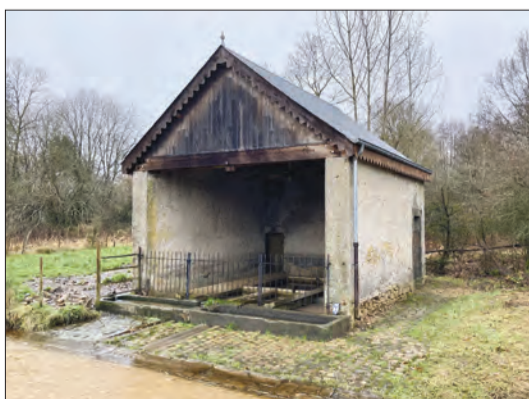
Le lavoir classé de Mortinsart (construction après 1895)

1. G. MATAGNE, Les fontaines de la province de Luxembourg, Annales de l'Institut Archéologique du Luxembourg, Arlon, 1974. 2. Archives de l'Etat à Arlon - AEA 090 - 305 à 362. Cf. également le Gletton n° 571 de novembre et 572 de décembre 2023.