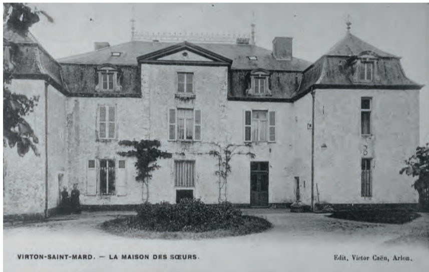
VIRTON-SAINT-MARD. — LA MAISON DES SŒURS. Edit. Victor Caën, Arlon.

En cette année 2024, après près de 70 ans d'exercice, l'ASBL La Gaume cessera son activité.